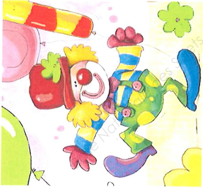
Planche documentaire :